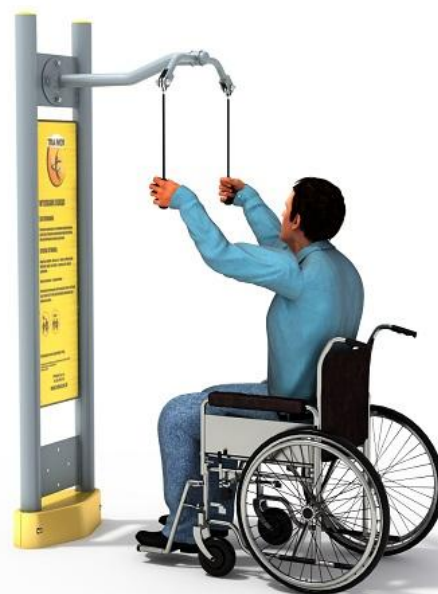
Przykładowa wizualizacja urządzenia.

Elementy konstrukcyjne: główna rura konstrukcyjna pylonu o średnicy 90 mm, grubość ścianki 3,6 mm, pozostałe rury o średnicy 90, 76, 60, 42, 34 lub 32 mm. Fundament na poziomie gruntu.