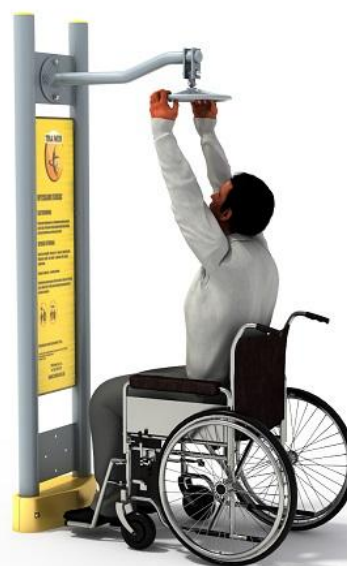
Przykładowa wizualizacja urządzenia.

Elementy konstrukcyjne: główna rura konstrukcyjna pylonu o średnicy 90 mm, grubość ścianki 3,6 mm, pozostałe rury o średnicy 90, 76, 60, 42, 34 lub 32 mm. Fundament na poziomie gruntu.