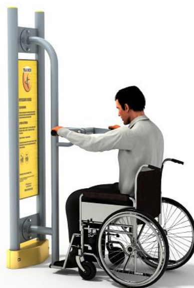
Przykładowa wizualizacja urządzenia.

Elementy konstrukcyjne: główna rura konstrukcyjna pylonu o średnicy 90 mm, grubość ścianki 3,6 mm, pozostałe rury o średnicy 90, 76, 60, 42, 34 lub 32 mm. Fundament na poziomie gruntu.