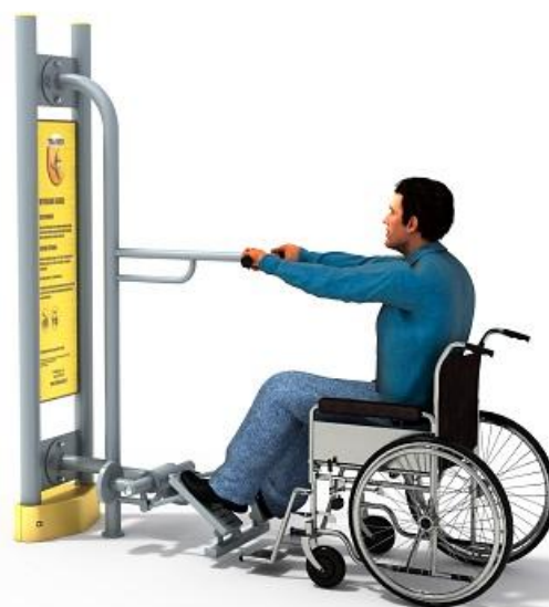
Przykładowa wizualizacja urządzenia.

Elementy konstrukcyjne: główna rura konstrukcyjna pylonu o średnicy 90 mm, grubość ścianki 3,6 mm, pozostałe rury o średnicy 90, 76, 60, 42, 34 lub 32 mm. Fundament na poziomie gruntu.