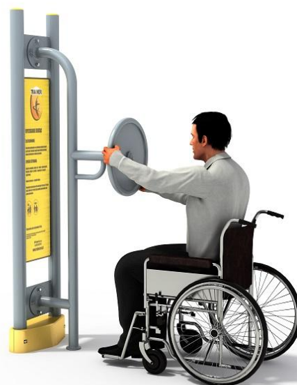
Przykładowa wizualizacja urządzenia.

Elementy konstrukcyjne: główna rura konstrukcyjna pylonu o średnicy 90 mm, grubość ścianki 3,6 mm, pozostałe rury o średnicy 90, 76, 60, 42, 34 lub 32 mm. Fundament na poziomie gruntu.